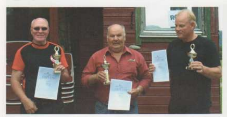
Medaljevinnerne i Nordic klassen