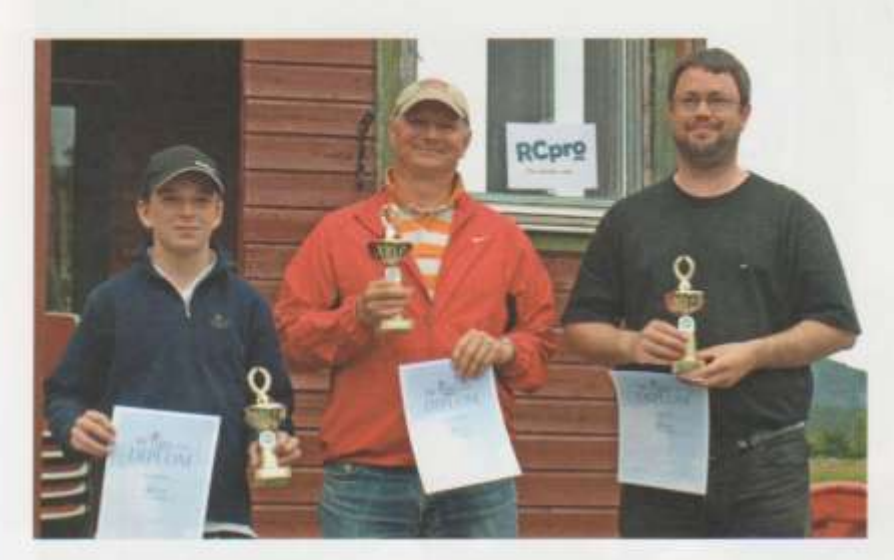
Over: Medaljevinnerne i Sport Klassen

Under: God mat og bare blide fjes på banketten