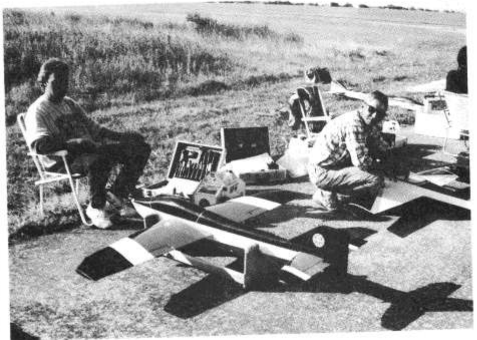
Siste sjekk av utstyret, Håkon Böhmer med sin DSM-Saphir

middagspause fra kl. 16.40 til 18.00 for at de som spiste i leiren skulle få middag og dommerne sin velfortjente pause. Torsdagsværet : jevn vind og