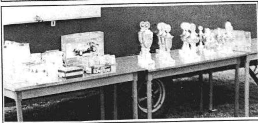
Det var som vanlig et fyldig og godt premiebord OS-ingene hadde laget til. De fleste kunne ta med seg et minne hjem fra NM 91.