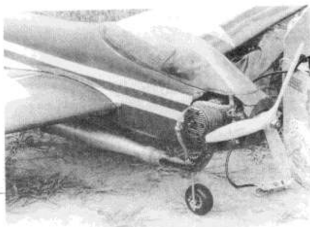
DEN SVENSKJE JUNIOREN INGEMARSSON KJØRER BLUE ANGEL MED TRE-BLADET PROPELL. DEN VAR UTROLIG STØYSVAK. NOE Å PRØVE FOR OSS I NORGE OGSÅ!