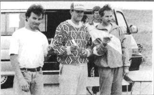
Dermed er lagseieren i havn. Os Aero Klubb sikret seiren med to førsteplasser og en sjetteplass.