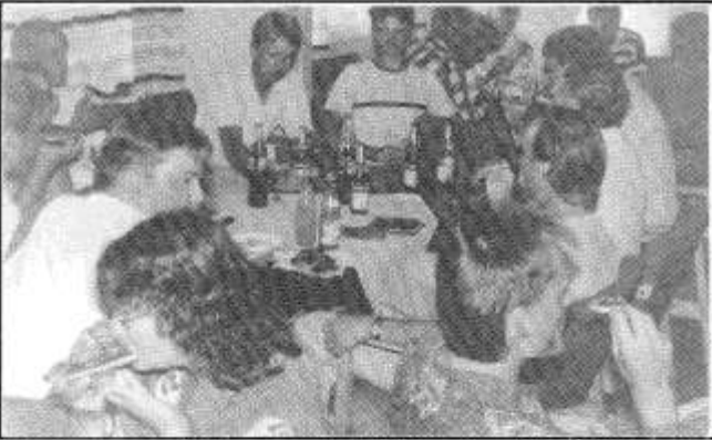
Fredag var det arrangert Pizza kveld på leiren. Et populært innslag i et ellers godt arrangert stevne.