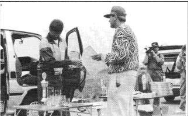
Det var flotte premier å hente for de beste.