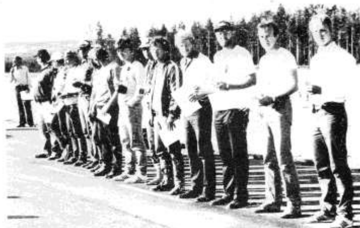
FAI "line up".