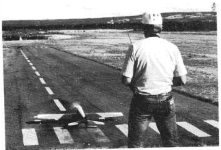
Erik Bertelsen tar av fra modellflystrina.