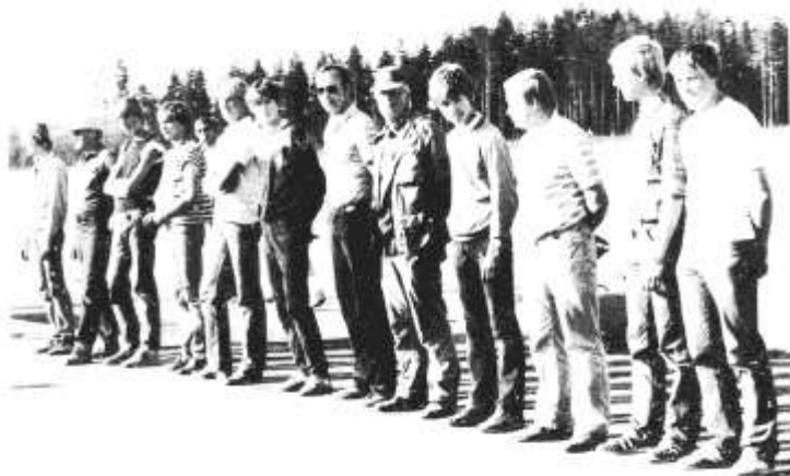
Vingtreff "line up".