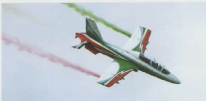
For full Opra og nasjonal farget røyk.