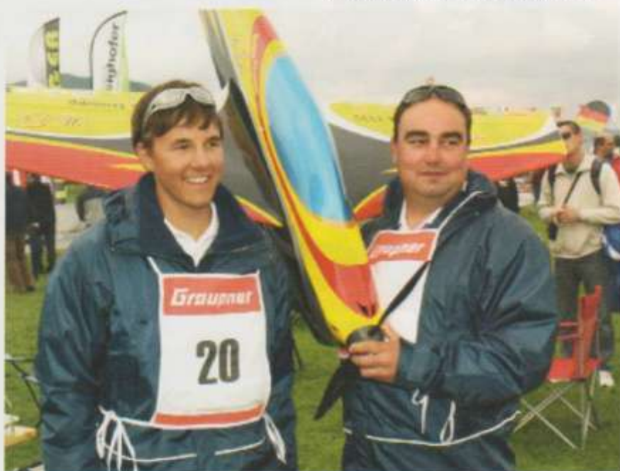
De to beste F3A pilotene i Skandinavia

Knut klarte seg ikke like bra, med 2 ikke