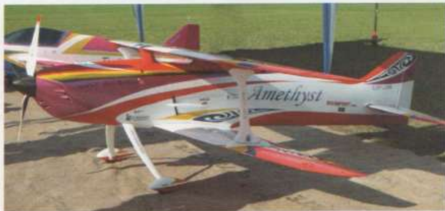
Modellfly Informasjon 1. 2011

Amethyst fra Oxai, den mest brukte dobbeltdekkeren i dette EM